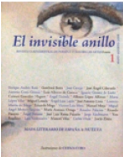
El invisible anillo 1. Ilustrado por CHEMA COBO 8,00 €

Nace aquí, ciento setenta años después que el autor de la afortunada expresión que da nombre a nuestra revista, una nueva aventura editorial que esperamos sepa conectar con vosotros, ánimos aficionados a este apasionante y desinteresado interés por su [más información ...]