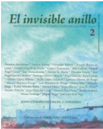
El invisible anillo.2. Ilustrado por ANGELO LUIS CALVO CAPA 9,00 €