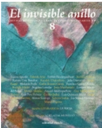
El invisible Anillo. 8. Ilustrado por ADELAIDA MURILLO 9,00 €

El extraordinario poeta venezolano JosÃ© Antonio Ramos Sucre, que, como muchos escritores del siglo pasado se suicidÃ³ ingiriendo una sobredosis de veronal, muriÃ³ en 1930 en Ginebra. En vida, su obra poÃ©tica, contenida en apenas tres libros de 346 poemas, n [mÃ¡s informaciÃ³n ...]