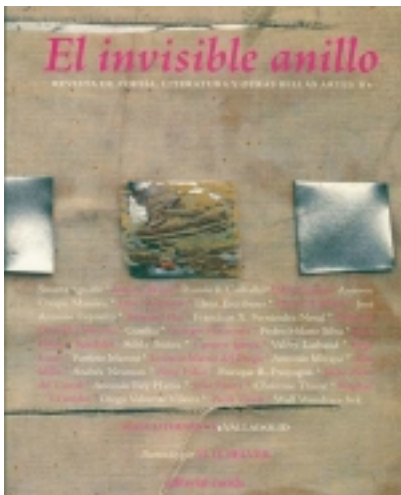
El invisible anillo. 5. Ilustrado por M. H. BELVER 9,00 €

Ambrose Bierce, aquel mordaz escritor norteamericano cuyo rastro se pierde misteriosamente en la revoluci3n mexicana, para convertirse en una leyenda de la literatura, en su heterodoxo Diccionario del Diablo, defin3a la realidad como el sue±o de un fil3s [m3s informaci3n ...]