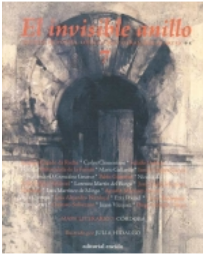
El invisible Anillo. 7. Ilustrado por JULIA HIDALGO 9,00 €