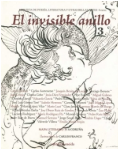
El invisible anillo. 3. Ilustrado por CARLOS FRANCO 9,00 €

Ambrose Bierce, aquel mordaz escritor norteamericano cuyo rastro se pierde misteriosamente en la revoluci3n mexicana, para convertirse en una leyenda de la literatura, en su heterodoxo Diccionario del Diablo, defin3a la realidad como el sue±o de un fil3s [m3s informaci3n ...]