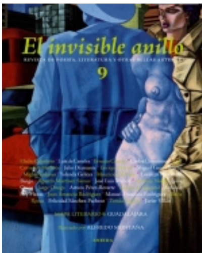
El Invisible anillo.9. Ilustrado por ALFEDRO MONTAÑA 9,00 €

Comienza el nÃºmero 9 con una buena muestra de poetas y cuentistas de uno y otro lado del AtlÃ¡ntico, veteranos y consagrados muchos de ellos; jÃ³venes y entusiastas, otros. Dentro de la secci3n Puntos de Vista nos gustarÃ-a destacar un estudio de Antonio Rey [mÃ;s informaci3n ...]