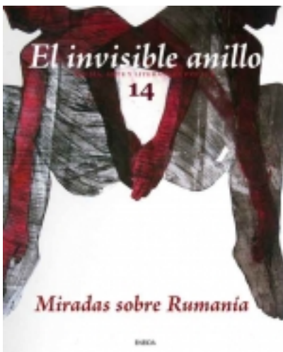
El invisible anillo 14. Miradas sobre Rumania 15,00 €

Nace aquí, ciento setenta años después que el autor de la afortunada expresión que da nombre a nuestra revista, una nueva aventura editorial que esperamos sepa conectar con vosotros, ánimos aficionados a este apasionante y desinteresado interés por su [más información ...]