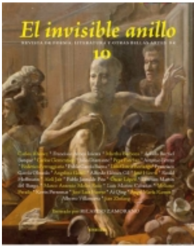
El invisible anillo.10. Ilustrado por RICARDO ZAMORANO 9,00 €

Esto que tienes entre tus manos no es una revista, no es tampoco un libro. Este original artefacto, intensa obra de arte, hermoso, por su armoniosa forma, contenedor de tantos sueños, es la obra y el aliento de un extraño pigmalión que, con la fuerza de [más información ...]