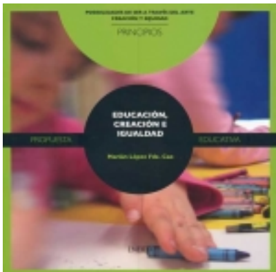
Principios. Educación, creación e igualdad. 7,50 €

Primera unidad que recoge las propuestas generales de la colección. Se dirigen a todas aquellas personas que estén interesadas en trabajar el arte de modo activo, vivo, participativo, centrado en valores humanos y solidario. [Más información ...]