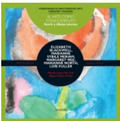
Sentir y dibujar plantas. BLACKWELL, SYBILLE MERIAN; LOËE FULLER 7,50 €

Frente a la rutina aparece la sorpresa, frente al hábito la transgresión, frente a lo ya sabido el riesgo; pero, sobre todo, frente a lo inesperado, irrumpe con fuerza la adaptación creadora [más información ...]