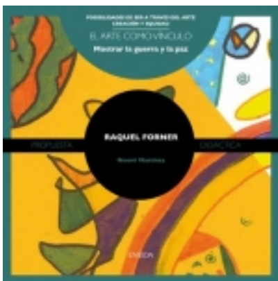
Raquel Forner 7,50 €

Primera unidad que recoge las propuestas generales de la colección. Se dirigen a todas aquellas personas que estén interesadas en trabajar el arte de modo activo, vivo, participativo, centrado en valores humanos y solidario. [Más información ...]