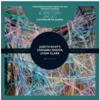
Los hilos de los sueños- SCOTT; SHIOTA Y LYGIA CKARK 7,50 €

Tres hilos entrecruzados. ¿Por qué, quién, qué? Tejer, hilar, enredar! palabras evocadoras que aluden al tiempo ralentizado, a la demora, a construir detenidamente con materiales muy humildes, a proteger, a cuidar, a interrelacionar, juntar, a habitar, a [más información ...]