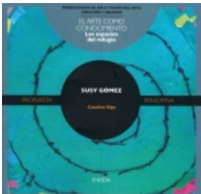
Los espacios del refugio. SUSY GÓMEZ 7,50 €

Susy Gómez es una artista española contemporánea muy versátil en cuanto a temática, medios, técnicas y materiales (fotografía, dibujo, pintura, escultura, instalación). centrarse en su obra ofrece un amplio abanico [más información ...]