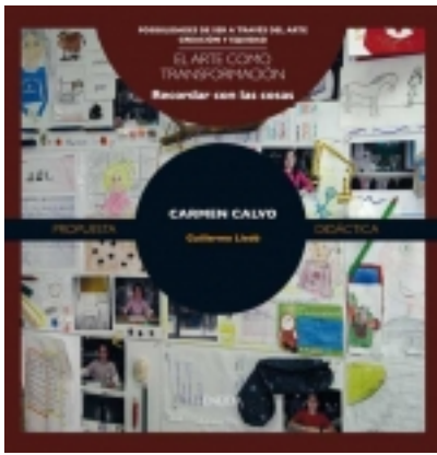
Recordar con las cosas. CARMEN CALVO 7,50 €

Carmen Calvo es una artista contemporánea española que lleva más de 30 años trabajando con el «objeto encontrado». Con ello se pretende mostrar a los niños el valor de las cosas que poseemos y el que pueden tener para otras personas, y, en consecuencia, a [más información ...]