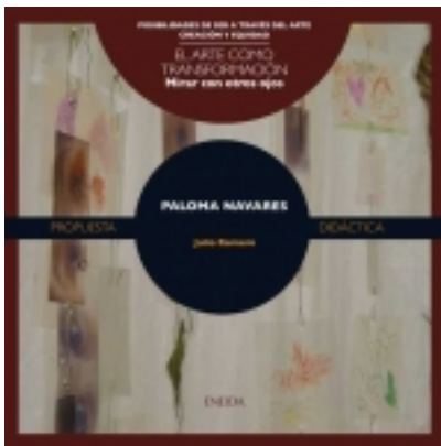
Mirar con otros ojos. PALOMA NAVARES. 7,50 €

Tres hilos entrecruzados. ¿Por qué, quién, qué? Tejer, hilar, enredar! palabras evocadoras que aluden al tiempo ralentizado, a la demora, a construir detenidamente con materiales muy humildes, a proteger, a cuidar, a interrelacionar, juntar, a habitar, a [más información ...]