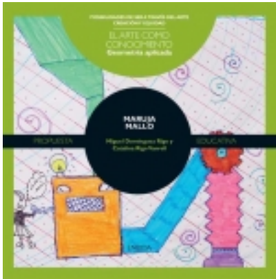
Geometría aplicada. Maruja Mallo 7,50 €

ÉXODOS recoge la experiencia desde la mirada de los y las artistas, del viaje, la migración, el exilio que muchos de ellos, que muchas de ellas, tuvieron que padecer. [más información ...]