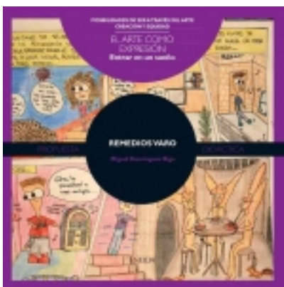
Entrar en un sueño. REMEDIOS VARO 7,50 €

Ana Mendieta ha trabajado a partir de su cuerpo la vinculación con la naturaleza y sus orígenes, temas que son adecuados para inculcar el respeto y el amor por cuanto nos rodea en niños y niñas. [Más información ...]