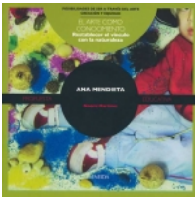
El vínculo con la naturaleza. Ana Mendieta 7,50 €

Nos interesaba que niñas y niños reflexionaran desde el inicio sobre la diferencia Queremos que se preguntaran sobre el inicio de los intercambios: su necesidad, sus comienzos, su lógica, la dificultad de los mismos y, por ello, el nacimiento de los o [Más información ...]