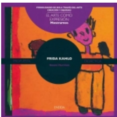
Mostrarnos. FRIDA KHALO 7,50 €

Fotógrafa, videoartista y artista multimedia, la obra de Paloma Navares abarca diversos lenguajes, en los que combina fotografía, vídeo, audio, escultura, instalación y performance. [más información ...]