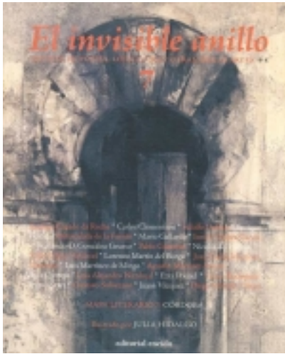
El invisible Anillo. 7. Ilustrado por JULIA HIDALGO 9,00 €