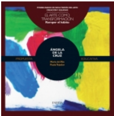
Romper el hábito. ÁNGELA DE LA CRUZ 7,50 €

Frente a la rutina aparece la sorpresa, frente al hábito la transgresión, frente a lo ya sabido el riesgo; pero, sobre todo, frente a lo inesperado, irrumpe con fuerza la adaptación creadora [más información ...]