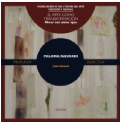
Mirar con otros ojos. PALOMA NAVARES. 7,50 €

Fotógrafa, videoartista y artista multimedia, la obra de Paloma Navares abarca diversos lenguajes, en los que combina fotografía, vídeo, audio, escultura, instalación y performance. [más información ...]