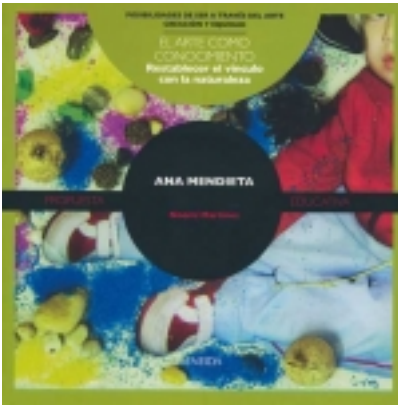
El vínculo con la naturaleza. Ana Mendieta 7,50 €

Ana Mendieta ha trabajado a partir de su cuerpo la vinculación con la naturaleza y sus orígenes, temas que son adecuados para inculcar el respeto y el amor por cuanto nos rodea en niños y niñas. [Más información ...]