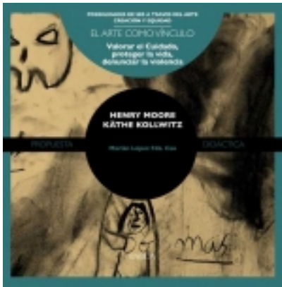
Kathe Kollwitz y Henry Moore 7,50 €

Se trata de trabajar el tema del cuidado tanto desde el punto de vista individual como social. Los niños viven como una profunda contradicción los mensajes de padres, y los mensajes simbólicos. profundamente fascinantes pero también profundamente violento [Más información ...]