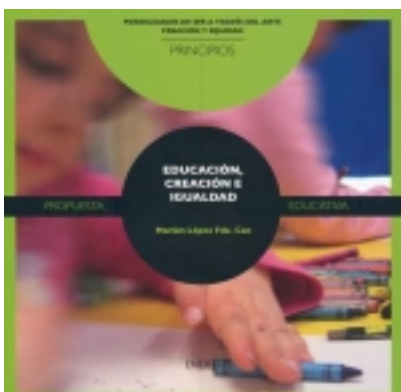
Principios. Educación, creación e igualdad. 7,50 €

Una de las razones de haber elegido a Frida Kahlo es conocer cómo esta artista siempre busca y afirma su identidad por medio de sus pinturas y cómo defiende sus raíces culturales a través de ellas. [más información ...]