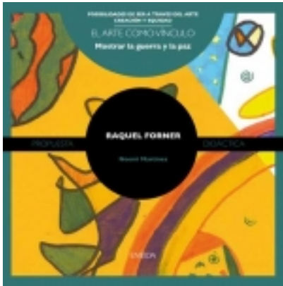
Raquel Forner 7,50 €

Primera unidad que recoge las propuestas generales de la colección. Se dirigen a todas aquellas personas que estén interesadas en trabajar el arte de modo activo, vivo, participativo, centrado en valores humanos y solidario. [Más información ...]