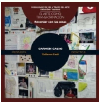
Recordar con las cosas. CARMEN CALVO 7,50 €

Conocer la obra de Raquel Forner permite a los niños ponerse en contacto y reflexionar acerca de la guerra, la destrucción, la muerte y el dolor que los conflictos armados ocasionan... [Más información ...]