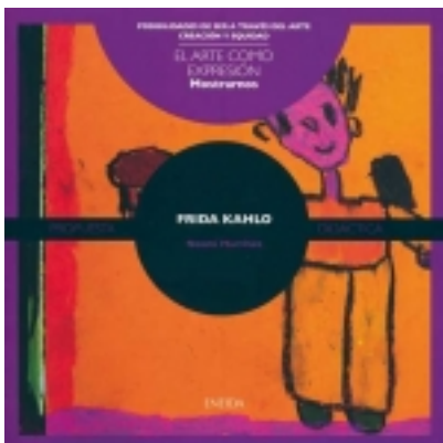
Mostrarnos. FRIDA KHALO 7,50 €

Fotógrafa, videoartista y artista multimedia, la obra de Paloma Navares abarca diversos lenguajes, en los que combina fotografía, vídeo, audio, escultura, instalación y performance. [más información ...]