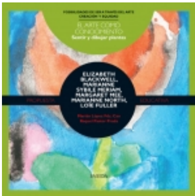
Sentir y dibujar plantas. BLACKWELL, SYBILLE MERIAN; LOËE FULLER 7,50 €

Frente a la rutina aparece la sorpresa, frente al hábito la transgresión, frente a lo ya sabido el riesgo; pero, sobre todo, frente a lo inesperado, irrumpe con fuerza la adaptación creadora [más información ...]