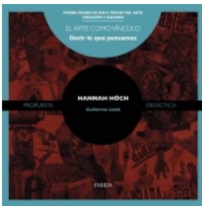
Decir lo que pensamos. HANNA HÖCH 7,50 €

PREMIO "ROSA REGÁ•S" 2010: http://www.20minutos.es/noticia/758899/0/