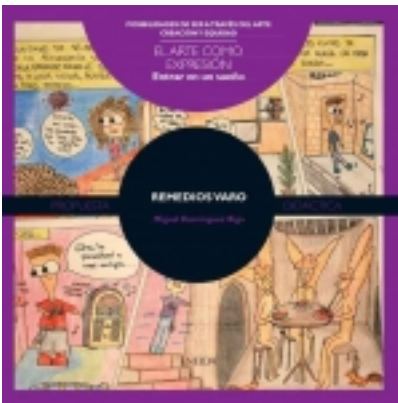
Entrar en un sueño. REMEDIOS VARO 7,50 €

Ana Mendieta ha trabajado a partir de su cuerpo la vinculación con la naturaleza y sus orígenes, temas que son adecuados para inculcar el respeto y el amor por cuanto nos rodea en niños y niñas. [Más información ...]