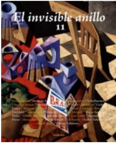
El invisible anillo. 11. Ilustrado por Varios Autores 9,00 €

Resumir los contenidos de este número no es tarea sencilla, dada la diversidad y complejidad de una estructura fuerte y dinámica como la buena literatura, y que con cada lector y, por supuesto, con cada nueva lectura cobra diferentes formas y razones. A [más información ...]