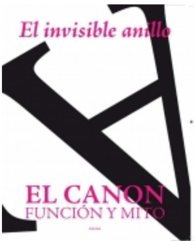
El invisible anillo. 12. Ilustrado por LUR SOTUELA 9,00 €

Resumir los contenidos de este número no es tarea sencilla, dada la diversidad y complejidad de una estructura fuerte y dinámica como la buena literatura, y que con cada lector y, por supuesto, con cada nueva lectura cobra diferentes formas y razones. A [más información ...]