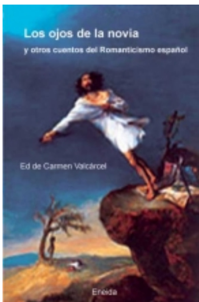
Los ojos de la novia y otros cuentos del romanticismo español. 11,00 €

San Juan de la Cruz es un clásico de nuestras letras. Su obra ha sido leída y releída a lo largo de los siglos con interpretaciones nuevas e inagotables. Sus versos, considerados por muchos críticos y poetas como los más sublimes de la literatura española [más información ...]